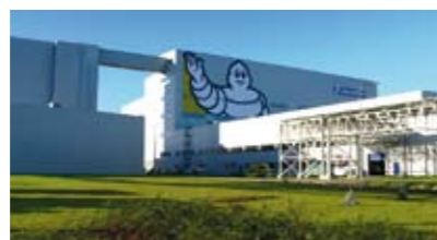
Usine Michelin, à Olsztyn Architectes : Tebodin Construction en huit mois d'un bâtiment industriel de 42 000 m 2 au Nord-Est de la Pologne.