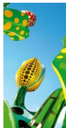
Les Tulipes de Shangri-La de Yayoi Kusama , symbole de l'engagement sociétal du groupe Rabot Dutilleul et de son soutien actif des acteurs du monde culturel.