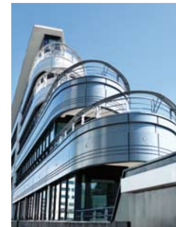
Triangle Part-Dieu, à Lyon Architecte : Babylone Avenue Réalisation d'un immeuble de bureaux en forme de vaisseau dans le quartier des affaires de la Part-Dieu. Prix de l'immobilier d'entreprise, aux Pyramides d'Or FPC.