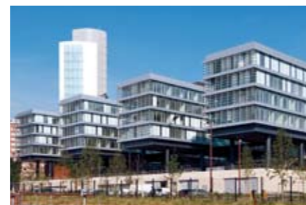
Siège de Région Nord - Pas-de-Calais, à Eurallille Architectes : L. Delemazure - Atelier Neveux Agence Trace et Governor - Sodég Ingénierie Construction d'un ensemble tertiaire comprenant des bureaux et des salles de commission, un hémicycle, destiné à accueillir les sessions de l'Assemblée, un « Signal », tour haute de 60 mètres, ainsi que plusieurs niveaux de parking souterrain.