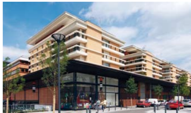
Cœur de Ville, à Valenciennes Architectes : Cabinet Alluin et Mauduit Construction d'un ensemble immobilier de 60 000 m 2 dans le cadre d'un vaste projet de rénovation urbaine. Cette opération comprend 20 000 m 2 de commerces sur deux niveaux, 2 000 m 2 de bureaux sur trois niveaux, 140 logements et 600 places de parking réparties sur trois niveaux souterrains.