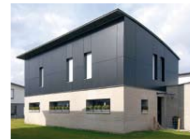
Domaine du Recueil, à Villeneuve d'Ascq Architecte : Gérard Zeller Dans la lignée de multiples références en la matière, 136 maisons de style contemporain ont été réalisées dans un nouveau quartier verdoyant et soigné.